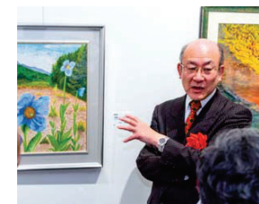
清水先生による講評会