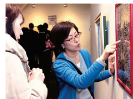
武田先生による講評会