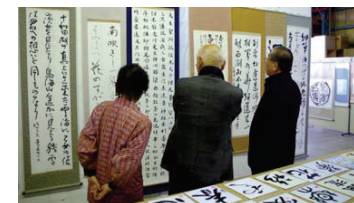
【書の部】審査の様子