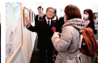
宇野先生による講評会