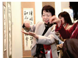
福島先生による講評会