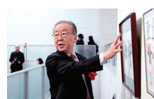
関先生による講評会