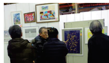
【絵画の部】審査の様子

★この動画は、審査結果発表後、IFACのホームページ（ https://www.ifac.or.jp ）でご覧頂けます。ぜひ、今後の参考にして下さい。