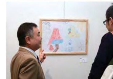
松下先生による講評会