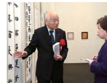
加藤先生による講評会