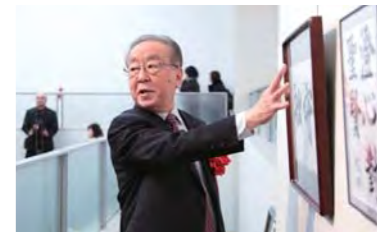
関先生による講評会