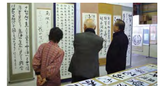
【書の部】審査の様子