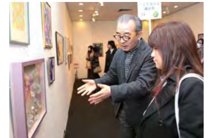
山本先生による講評会