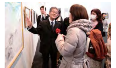
宇野先生による講評会