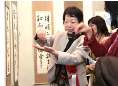
福島先生による講評会