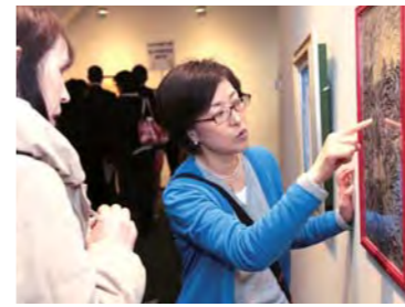
武田先生による講評会