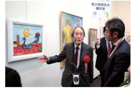
荒川先生による講評会

この講評会は、審査に当たられた先生方が、さまざまな作品を通して、個々の講評をされますので、入選された方、選外になった方を問わず、今後の作品制作のための、「ヒント」が得られる、貴重な機会と申せましょう。