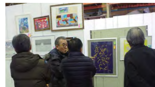
【絵画の部】審査の様子

★この動画は、審査結果発表後、IFACのホームページ ( https://www.ifac.or.jp )にてご覧頂けます。ぜひ今後の参考として、お役立て下さい。