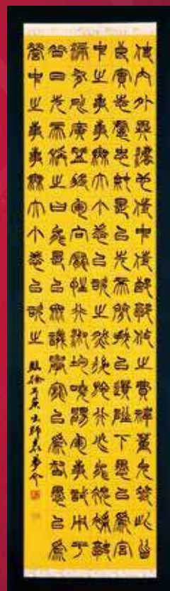
「徐三出師表」後藤夢介 埼玉県立大宮光陵高等学校