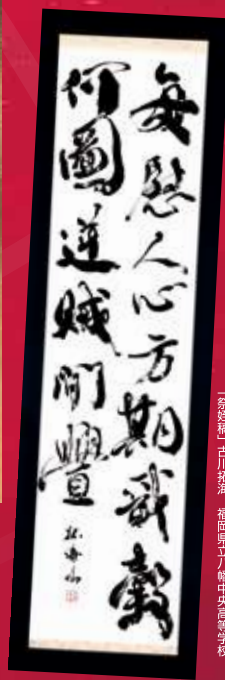
「祭壇」古川若海 福岡県立八幡中央高等学校