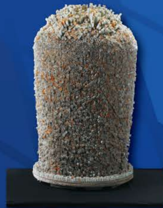
2014年度 文部科学大臣賞「宙のすみか」愛媛県立松山高等学校3年 青井 星朗

※ WEB上で簡単に「QRコード入り出品票」を作成できます。 詳しくは、ホームページ ( http://www.ihsaf.net ) をご覧ください。